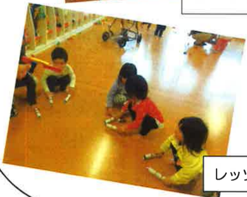
レッツ！ダンシング！