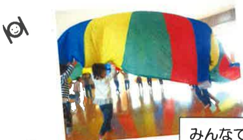
みんなで力を合わせて…

6月3日（土）に運動会が開催されます。なでしこ広場では「ファイト！！」の掛け声でマラソンをしたり、お遊戯室ではバルーンの練習やかけっこの練習を毎日頑張っている子ども達です。はやぶさ組のバルーン練習を「かっこいいな！」「すごいな！」と見ているあぼろ、ペがさすの子ども達は目を輝かせています。運動会本番でのたくましく、成長した姿を見るのが楽しみです。本番に向けて、練習を頑張っていきます！！