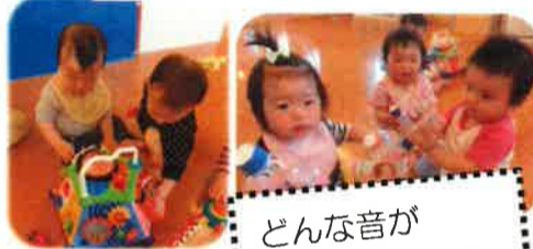
どんな音が出るのかな?