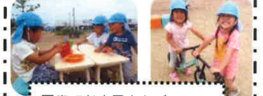
園庭でお店屋さんごっこ☆