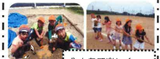
みんなで楽しく 運動会ごっこ!