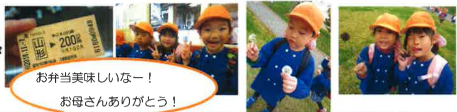
お弁当美味しいなー! お母さんありがとう!

以上児クラスは、秋の自然を探しに園外保育に行ってきました。年長児は初めて電車に乗っての園外保育!自分達で切符を買い、電車に乗って公園まで移動しました。どんぐり拾いをしたり、遊具で遊んだり、お弁当開きをしたり・・・子ども達の笑顔が輝いた楽しい一日でした。