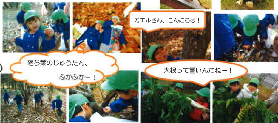
落ち葉のじゅうたん、ふかふかー!