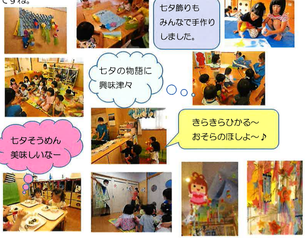
七夕飾りもみんなで手作りました。

各家庭で書いてきてもらった短冊には「自転車に上手に乗れますように」「お友だちとたくさん遊べますように」「ディズニーランドに行けますように」など、様々な願い事が！皆さんの素敵な願い事、叶うといいですね。