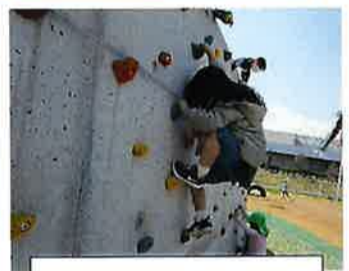
ボルダリングに挑戦！