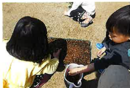
ここに入れてみよう！