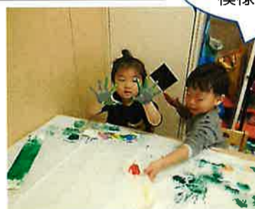
手形で思いきり 模様を作ったよ！