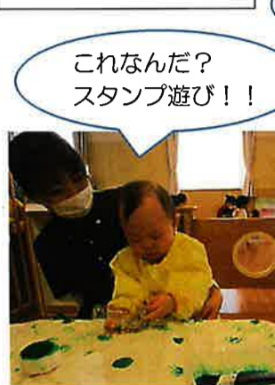
これなんだ？ スタンプ遊び！！