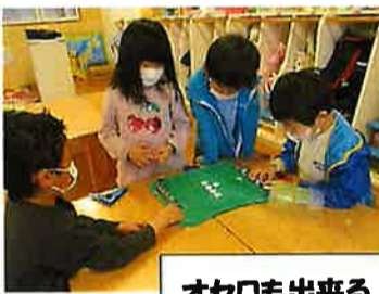
オセロも出来るようになったよ！