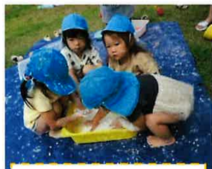
片栗粉ってドロドロ、キコキコ... いろんな感触、不思議だね!

子どもは0歳から遊びの天才です。水遊びから「泡遊び・氷遊び・感触遊び」等、各クラスごとに様々な遊びを展開させ、この夏も子ども達は目を輝かせながら、夏ならではの遊びを思いきり楽しみました。まだまだ子ども達の遊びは進化を遂げていくようです!