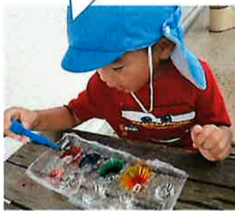
混ぜたら何色になるのかな? やってみよう!