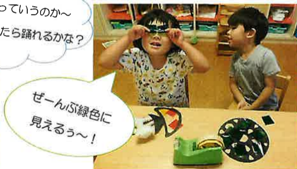
ぜーんぶ緑色に見えるう~!