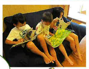
シリーズ 全部人気です!