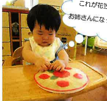
これが花笠っていうのか~ お姉さんになったら踊れるかな?