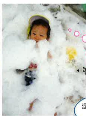
泡のお布団?! きーもちい~