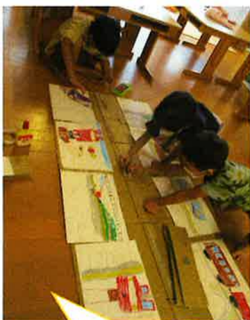
みんなで線路作り!