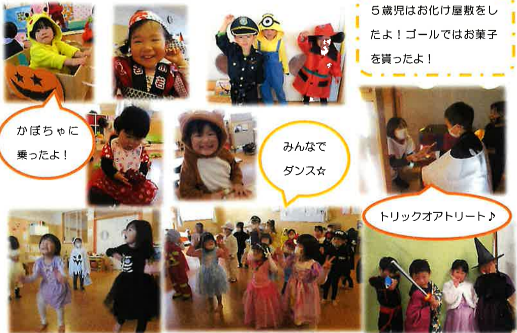
5歳児はお化け屋敷をしたよ！ゴールではお菓子を貰ったよ！

10月31日、各クラスでハロウィンの雰囲気を感じ、思い思いにハロウィンパーティーを楽しみました。プリンセスやヒーローに変身した子ども達は、いつもとは違った一日を存分に楽しんでいました！