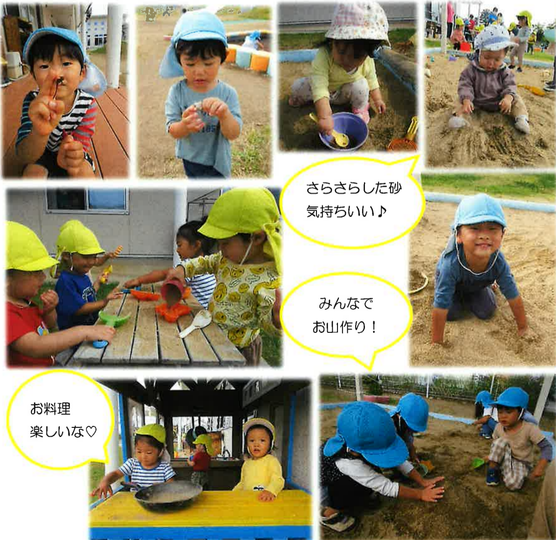
さらさらした砂 気持ちいい♪

10月は過ごしやすい気温となり、お外遊びを満喫しました！！0、1、2歳児の園庭では、虫捕まえや砂遊び等、大好きな外遊びをのびのびと体を動かしながら思いきり楽しんでいます！